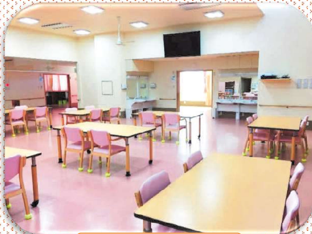
食堂・機能訓練室